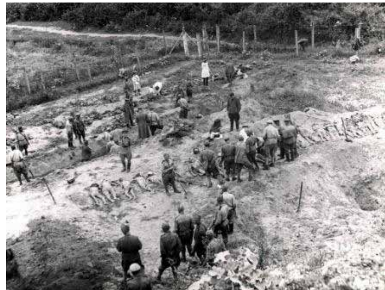
*Фотографії з ГАРФ (Державний архів Російської Федерації)